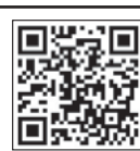
会長挨拶用 QRコード

爪は健康を知る上で重要だそうです。色や艶や割れなどで健康状態がわかるそうです。皆様の爪はいかがですか？