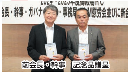
前会長・幹事 記念品贈呈