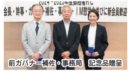
前ガバナー補佐・事務局 記念品贈呈