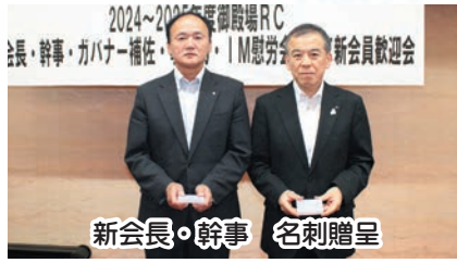
新会長・幹事 名刺贈呈