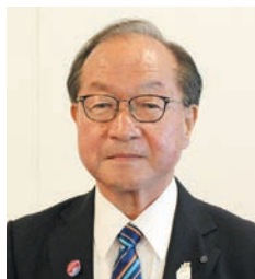
2024-2025年度 静岡第2グループ ガバナー補佐